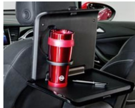
2 pohártartós asztalka 2 moduláris csatlakozó