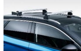
Keresztirányú tetőrudak hosszanti tetősínhez