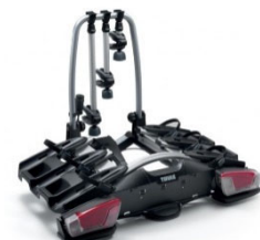
Coach 276 3 db-os bicikli tartó