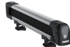
Snowpack 7324 tartó: 4 db síléc / 2 db snowboard