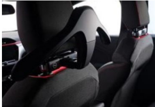
FlexConnect moduláris csatlakozó és vállfa