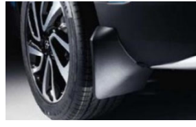
Hátsó öntött sárfogó készlet