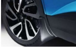
Első öntött sárfogó készlet