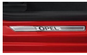
Első alumínium hatású Opel küszöbborítás