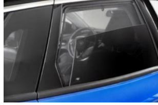
Hátsó és hátsó oldalsó árnyékoló szett