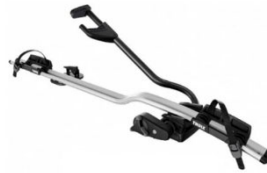
Expert 298 1-db-os kerékpártartó