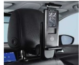
2 univerzális tablet tartó 2 moduláris csatlakozó