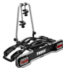
Euroride 941 2 db-os bicikli tartó, lehajtható