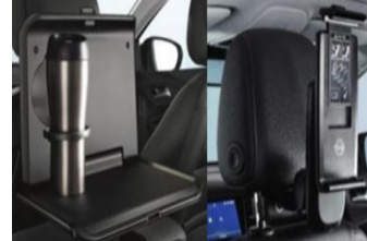
1 asztalka + 1 univerzális tablet tartó + 2 csatlakozó