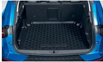
Mosható gumi csomagterétálcá (kivéve Plug-In Hibrid verzió)