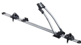
Freeride 532 1-db-os kerékpártartó